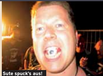
Sute spuck's aus!

Der Platz hinter Aßmannshardt bei Biberach hat seinen Zeltplatz etwas abseits vom Treffensplatz und so hätte man seine Ruhe wenn man sich zum Schlafen legen würde. Aber das ist nicht angesagt, weil das Fest zum Festen da ist und nicht zum Schlafen. Dort unten an der Straße beim Zeltplatz steht