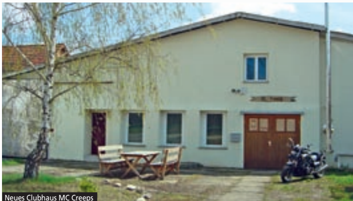
Neues Clubhaus MC Creeps