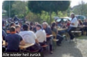
Alle wieder heil zurück