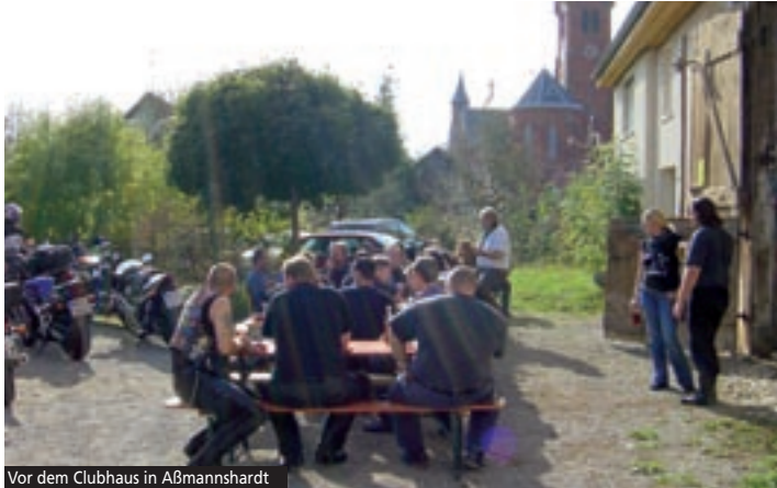
Vor dem Clubhaus in Aßmannshardt

zusammen an. Am Clubheim waren in der Sonne schon die Bänke aufgestellt, der Kaffee duftete (auch wenn